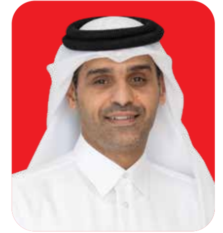
الشيخ/ محمد بن عبدالله آل ثاني رئيس مجلس الإدارة