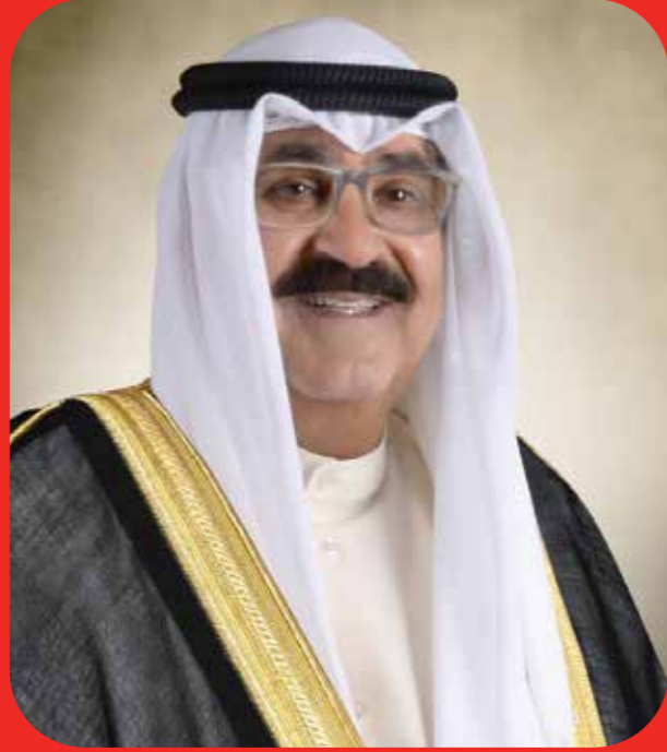
سمو الشيخ مشعل الأحمد الجابر الصباح ولي عهد دولة الكويت