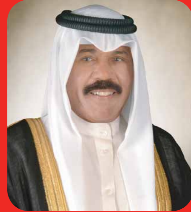
صاحب السمو الشيخ نواف الأحمد الجابر الصباح أمير دولة الكويت