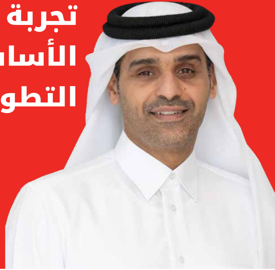
محمد بن عبدالله آل ثاني رئيس مجلس الإدارة

"في عام 2022 أخذنا على عاتقنا ترقية كل ما يدور حول علامة Ooredoo التجارية. لقد ركزنا وركزنا جميع الجهود حول عملائنا ، ووضعنا بشكل استباقي الاستراتيجيات والأهداف التي تعود إلى تعزيز تجربة العملاء مع العلامة التجارية وتطوير تقنياتنا الموجودة مسبقاً من خلال التطورات الرقمية واعتماد أحدث التقنيات المتاحة لإنشاء شبكة متقدمة رقمياً. سنستمر في تقديم حلول ذكية ورقمية متطورة ، بالإضافة إلى الاستمرار في ابتكار وتحديث وتحديث البنية التحتية لشبكات المجموعة. سنتخذ خطوات مهمة في تعزيز الشراكات والاتفاقيات طويلة الأجل مع القطاعات الأخرى ، مثل القطاعين المالي والحكومي ، من أجل تقديم خدمات من شأنها أن تسهم في استمرار وتيرة الأعمال وتوفير فرص النمو.."